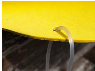
F2: La señal tiene 4 orificios en la base