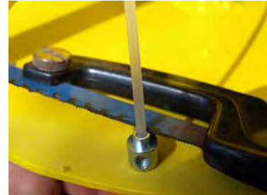
F3: corte el hilo sobrante ya tensado

Para cualquier aclaración no dude en consultar: SERVICIO TECNICO 649 45 40 60