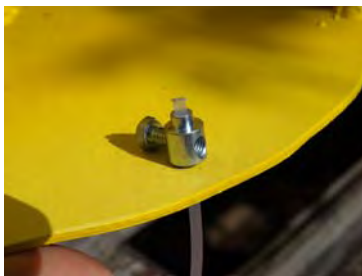
F1: Inicio del trenzado

Este trenzado garantiza que durante los temporales la señal de tope no ejerza una tensión excesiva sobre la tapa superior de la linterna.